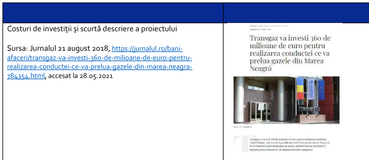
Tabel 1 – Imagini din recenzii media

În general, imaginea proiectului în mass-media este pozitivă și articolele care au fost publicate în perioada 2017-2018 au fost în principal despre explicarea proiectului și informarea în mare a publicului cu privire la configurarea proiectului. Imaginile de mai jos sunt instantanee din diferite ziare online unde s-a reflectat dezvoltarea proiectului: