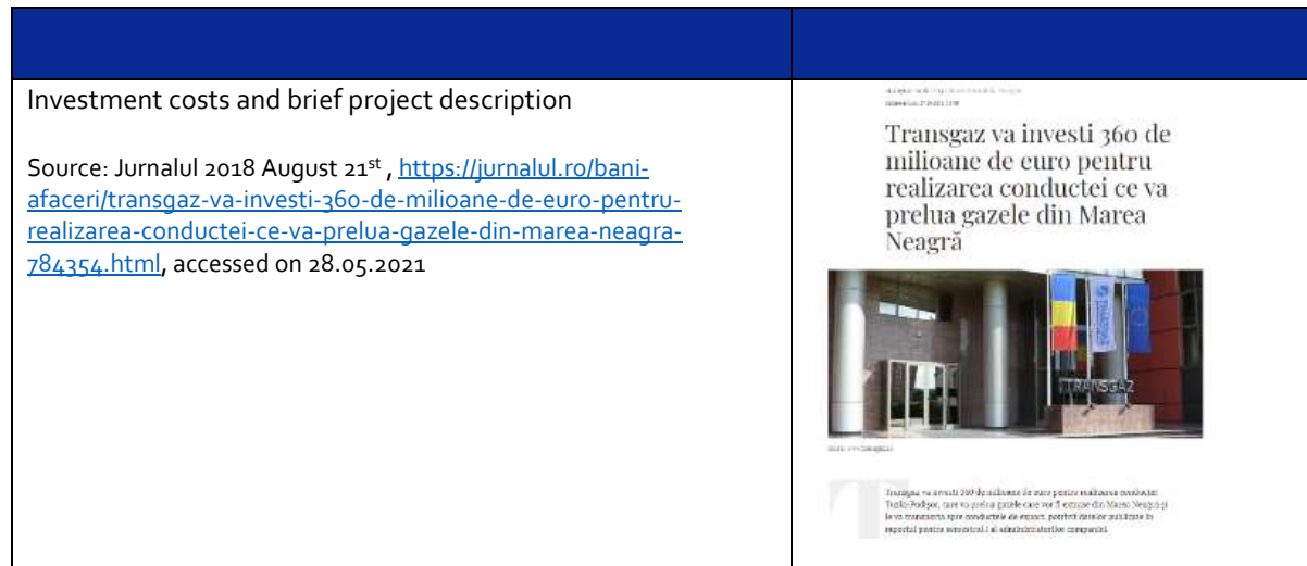
Table 1 – Media Review snapshots

In general, the mass media coverage is positive and the articles that have been published during 2017 – 2018 were mainly about explaining the project and informing the public at large about the project setup. The images below are snapshots from different online newspapers where the project development was reflected: