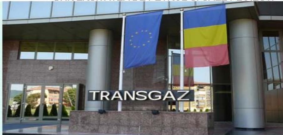
UNIVERSITATI PUTERNICE PENTRU COMPANII PUTERNICE