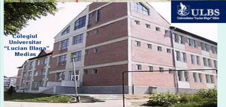
Colegiul Universitar "Lucian Blaga" Medias