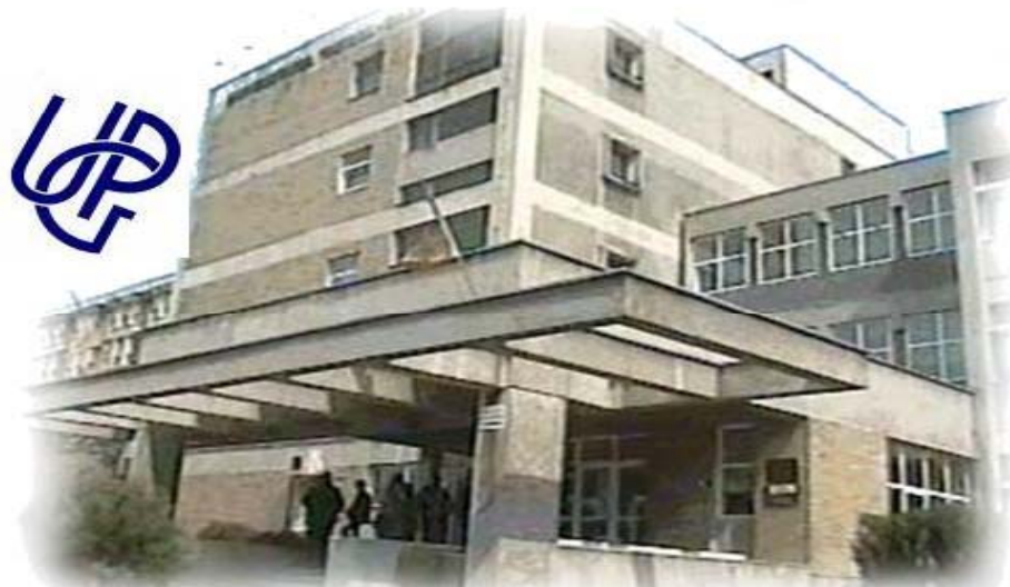
UNIVERSITATEA DE PETROL SI GAZE PLOIESTI